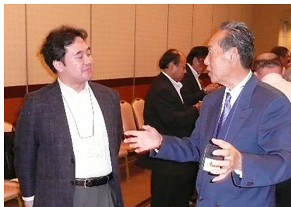
懇親会で組合員 (株森下商会森下社長) と 歓談される小木津先生 (左)