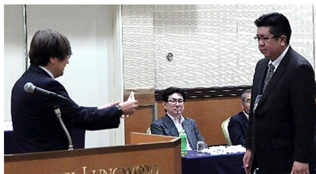
年間第 2 位報賞の(有)竹之下部品商会竹之下社長 (右)