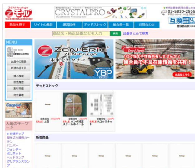
ZEN-bukyo モールのトップ画面

現在鋭意公開に向けて作業を進めていますが、利用上のガイドライン作成などの案内が組合員に事前に必要になるなど、準備に時間を要していることから、7月公開を延期し、9月を目途に公開することとしています。